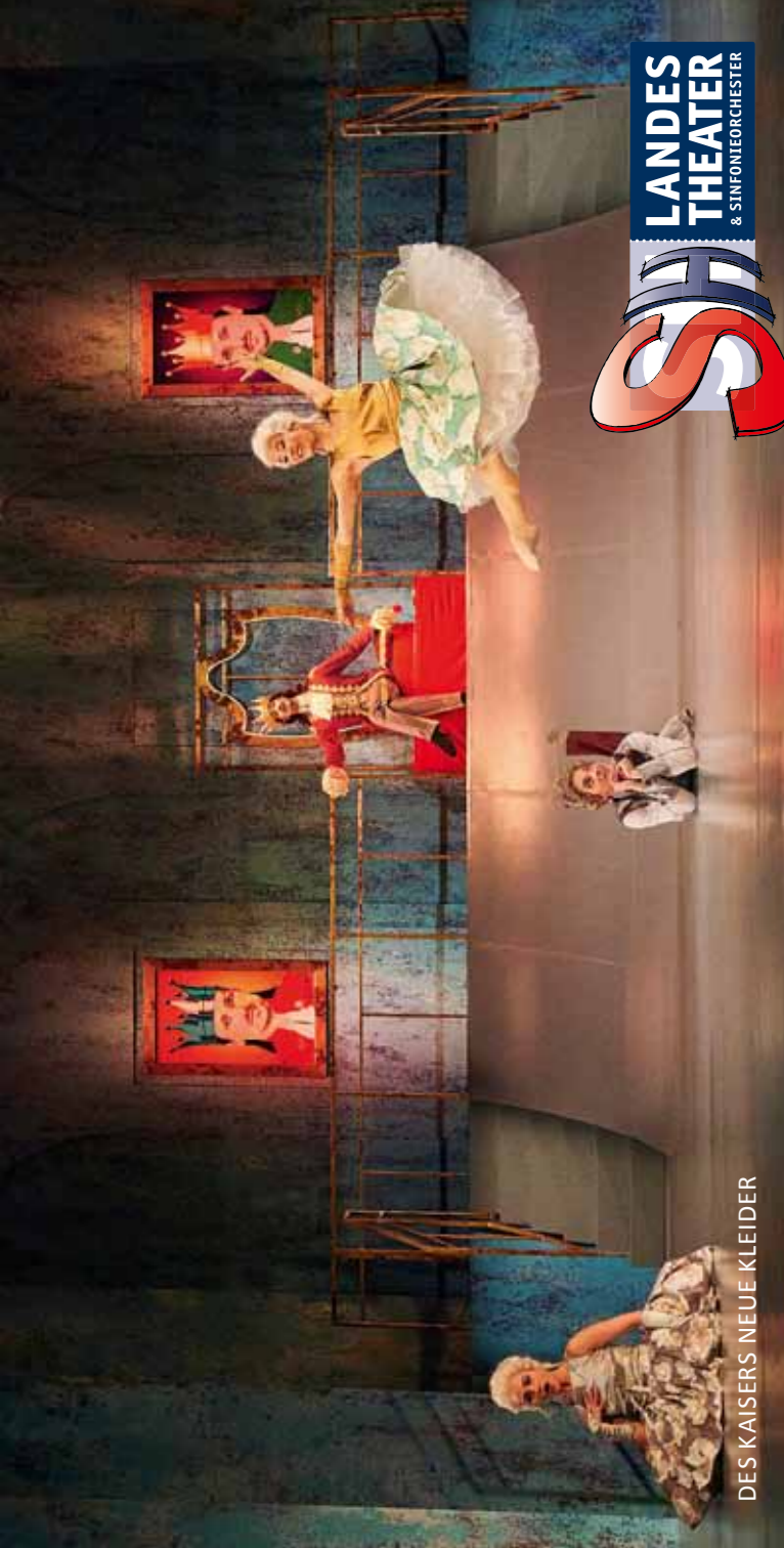
DES KAISERS NEUE KLEIDER