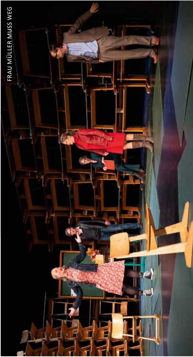
FRAU MÜLLER MUSS WEG