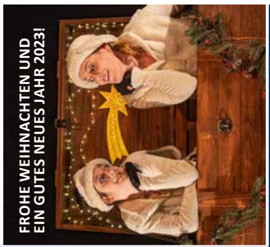
FROHE WEIHNACHTEN UND EIN GUTES NEUES JAHR 2023!