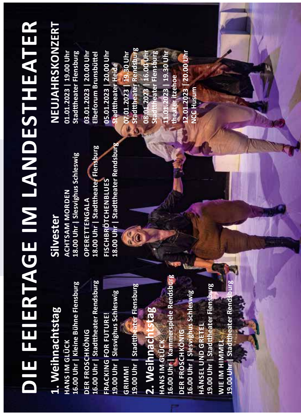
DIE FEIERTAGE IM LANDESTHEATER