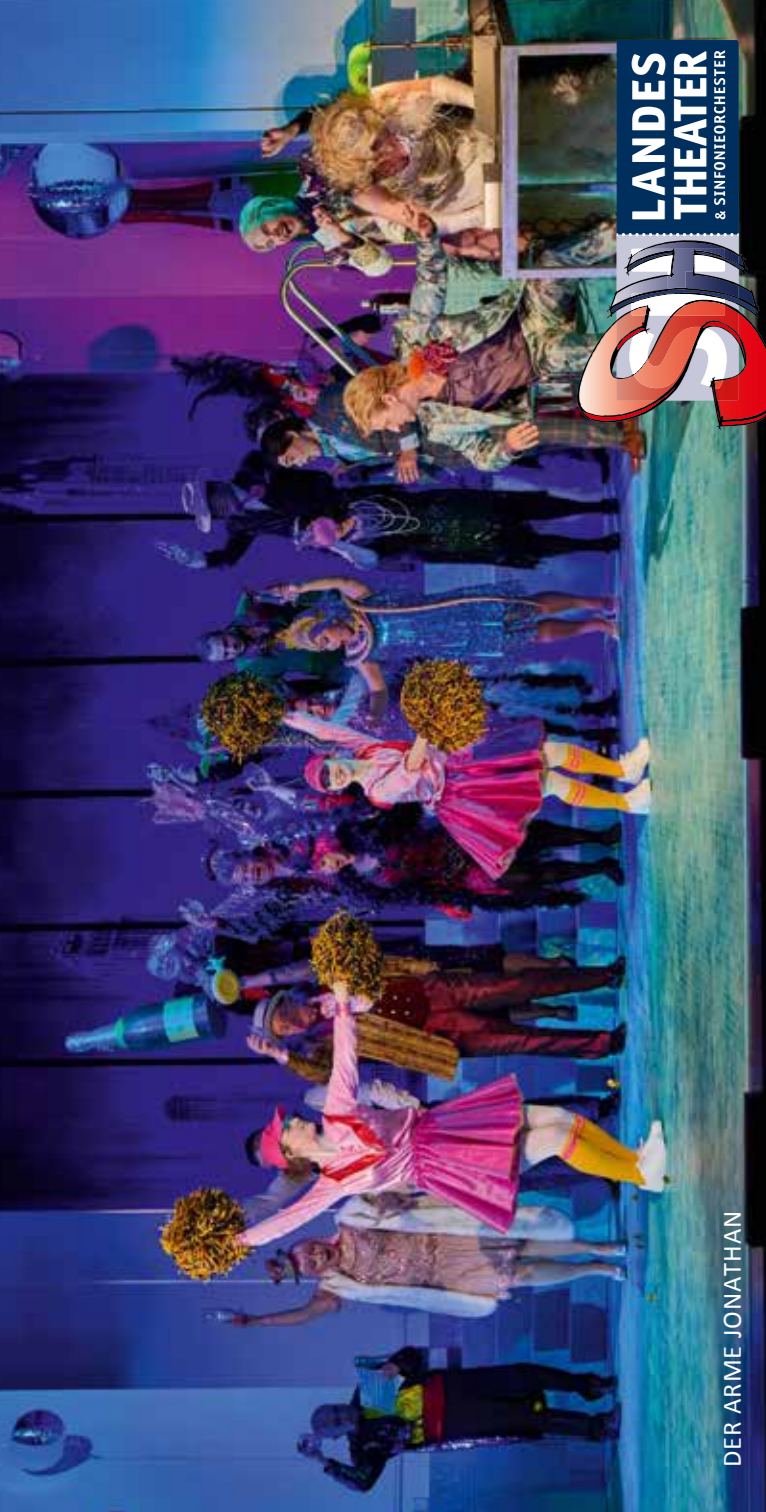
DER ARME JONATHAN